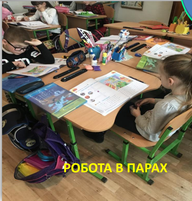
РОБОТА В ПАРАХ